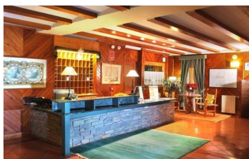
email : contact@sba-skisnow.com Internet : http://www.sba-skisnow.com