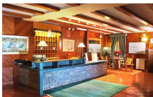
email : contact@sba-skisnow.com Internet : http://www.sba-skisnow.com